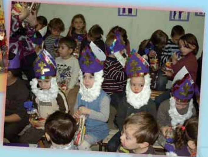
A l'école élémentaire