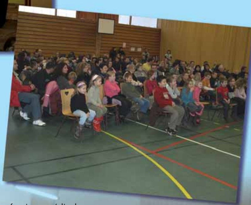
Présentation des vœux du Maire pour l'année 2010 au personnel communal, enseignants, responsables d'associations, commerçants, artisans et professions médicales