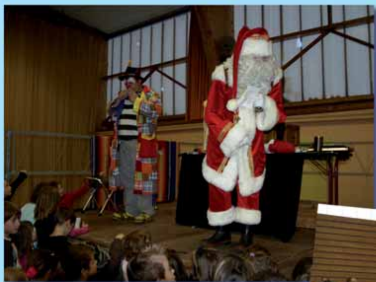
La municipalité a offert un spectacle de magie aux enfants de la commune en attendant le passage du Père Noël pour une distribution de friandises