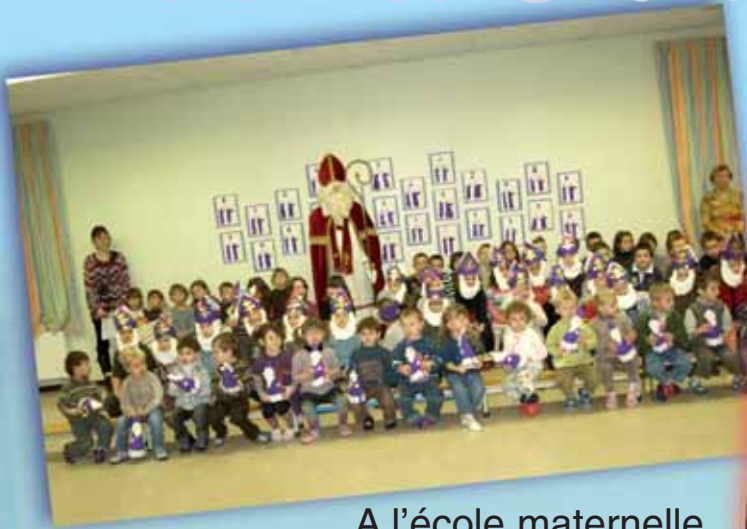
A l'école maternelle