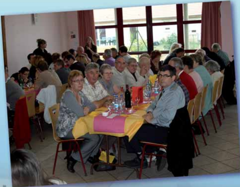
Assemblée générale de l'ASCL du 11 décembre 2009

bien tendu accompagné de riz cantonnais, de riz parfumé et de bière chinoise. L'ASCL espère pouvoir refaire un tel repas en mars 2010.