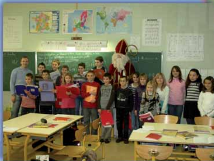
A l'école élémentaire